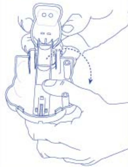
Schéma 5c Fixez le corps de l'hippopotame sur son emplacement, sur le plateau de jeu.

Schéma 5b Tenez le cou en place et remplacez l'hippopotame à l'endroit.