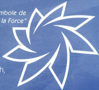
Symbole de "Basculement de la Force"