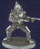
Jango Fett (Le Mal)