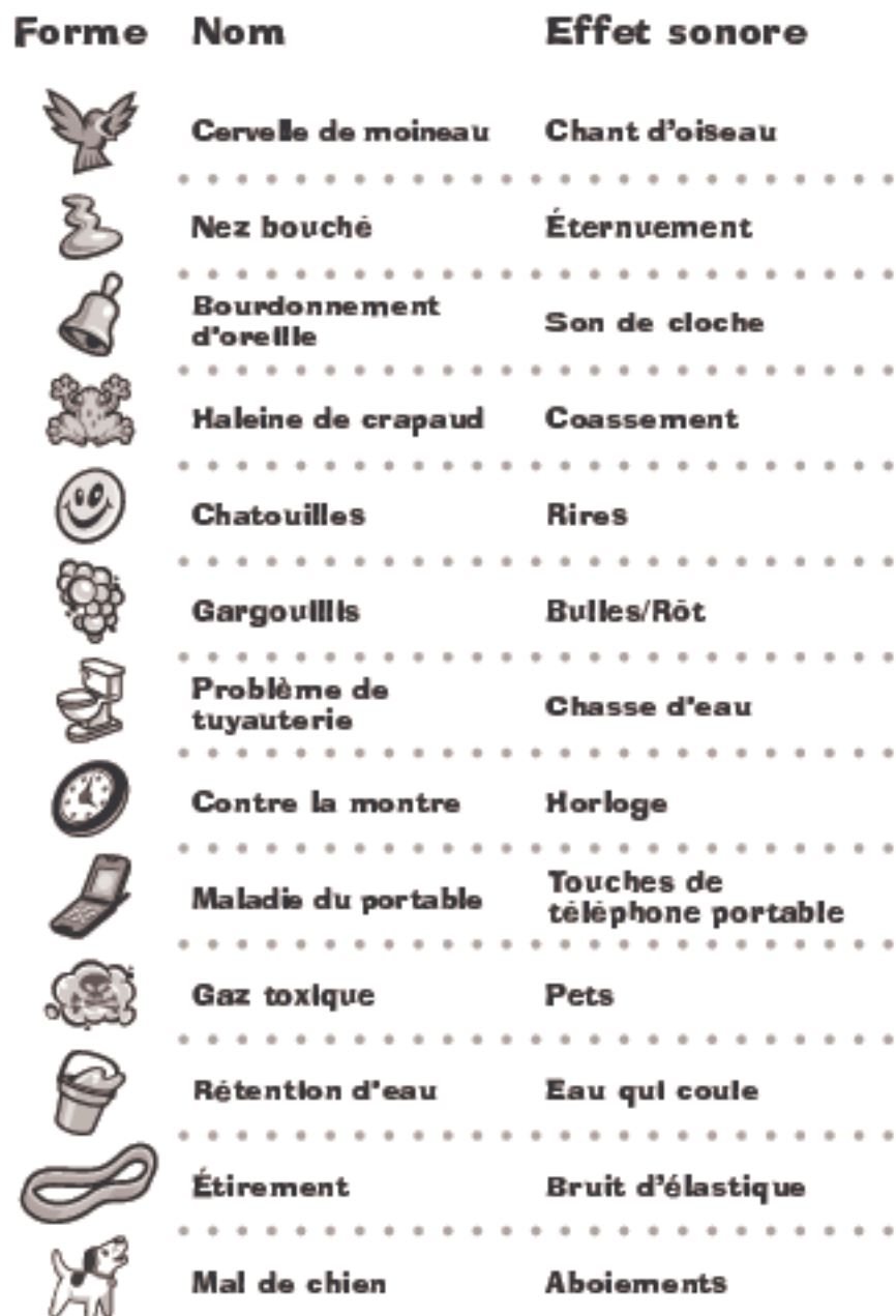
Tableau des pièces