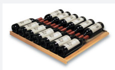
« Coulissante » 13 Bouteilles