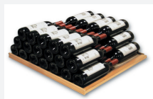
« Empilage » 78 Bouteilles

La clayette AHUI est universelle, elle peut être positionnée en :