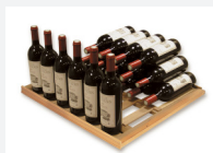
« Présentation » 38 Bouteilles

La clayette AHUI d'ArteVino est équipée d'une porte étiquettes :